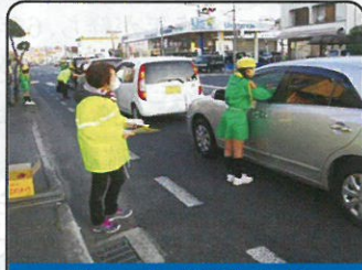
福山西・柳津支部