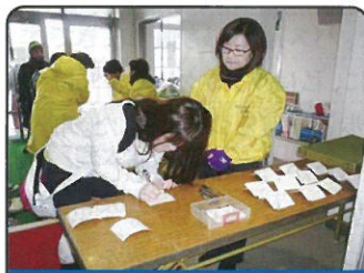
木江・女性部会等