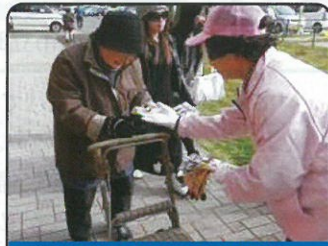
安芸地区・女性部